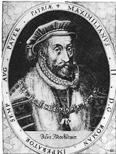
Австрійський імператор Максиміліан II

Хоча австрійський імператор-цар і вважався суверенним володарем, однак його влада була досить обмеженою й полягала у виконанні представницьких функцій, а також скликанні законодавчих зборів — Рейхстагу. Імператор лише санкціонував прийняті цим загальнодержавним органом закони та був сюзереном для васальнозалежних князів і лицарів імперії. Однак гасло «Австрія має володіти всесвітом» (« Austriae est imperare orbi universo »), яке імператор Фрідріх III (1437–1493) у вигляді аббревіатури AEIOU додавав до свого підпису, було актуальним для августійших володарів імперії і протягом наступних століть. Володар імперії уособлював у собі дві різні владні функції: