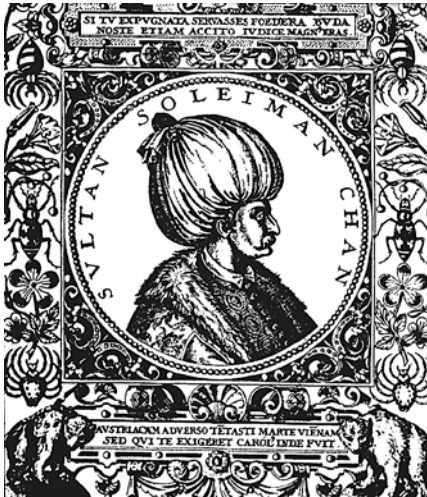
Турецький султан Сулейман I

міжнародній торгівлі в цьому регіоні 35 . Певними автономними правами володіли правителі Албанії, які під впливом Туреччини прийняли іслам. Лише наприкінці XVI ст. Османській імперії вдалося підкорити собі Чорногорію, яка, однак, протягом наступних десятиліть насильного турецького протекторату опиралася сплаті данини.